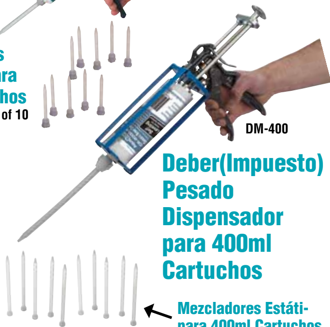
Mezcladores Estáticos para 400ml Cartuchos SM-0824 Pack of 10