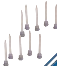
SM-5416 Pack of 10