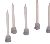
SM-5416 Pack of 10